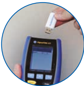
Enkel överföring av testresultat med ett USB-minne