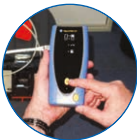
Autotest på remote-enheten för enmansanvändning

SignalTEK CT ger även nätverksägaren en försäkring om att de installerade länkarna stödjer bandbreddstunga applikationer såsom VoIP, IP CCTV och video streaming efter flyttar och förändringar.